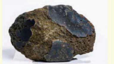
「火星の石」 高さ16cm、幅29cm(ラグビーボールぐらい)、重さ13kg ▶

「火星の石」は、2000年に南極で日本の観測隊が発見し、その後の分析で数万年前に火星から地球に飛来した隕石であることが確認されています。水と反応してできる成分が含まれていることから、火星に水があることを示す貴重な資料だとされています。生物の起源を示す学術的な価値も高く、万博のテーマの「いのち」に深く関わる展示になるといわれています。「火星の石」として全期間展示されます。また、隕石のかけらも同時に展示され、触れることができる予定です。