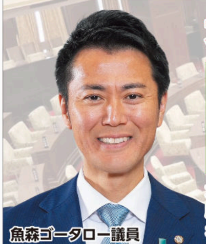
魚森ゴータロー議員

発行 大阪維新の会 大阪府議会議員団 http://osaka-ishin.jp/ 〒540-8570 大阪市中央区大手前 2丁目1番22号(大阪府庁内) TEL (06) 6946-5390 FAX (06) 6946-5391