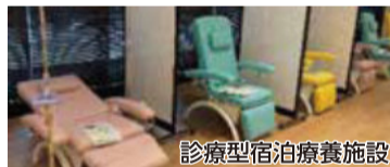
診療型宿泊療養施設