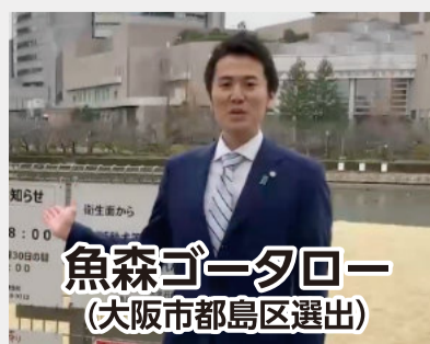
魚森ゴ-夕ロー (大阪市都島区選出)