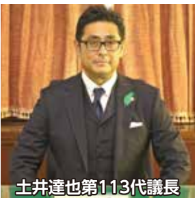
土井達也第113代議長